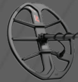
Bobina EQX15™ con placa de deslizamiento doble D elíptica de 15"x12" – Sumergible a 5 m [16 pies]